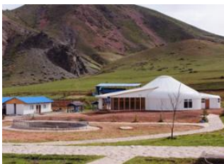
Aéroport de Manas 📍 🚗 60km - ⌚ 1h 30m Kyrgyz Ayili 📍