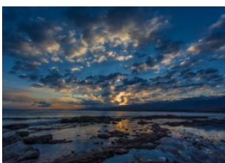
Kyrgyz Ayili 📍 🚗 250km - ⌚ 4h Balykchy 📍 🚲 65km - ⌚ 3h 30m Sary Oi 📍