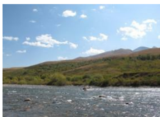
Bishkek 📍 320km - 🕒 5h 33m Talas 📍