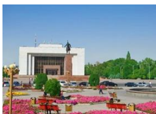
Aéroport de Manas 📍 🚗 30km - 🕒 40m Bishkek 📍