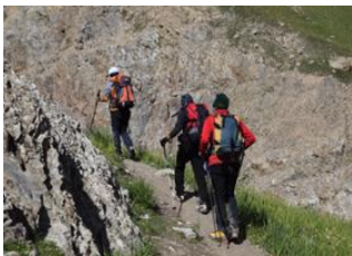
Achik-Tash Base Camp (3600 m)