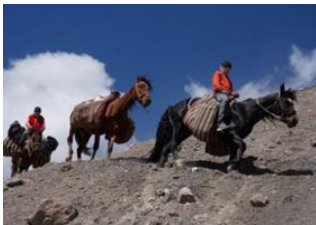
Achik-Tash Base Camp (3600 m)