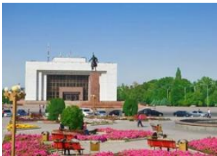
Aéroport de Manas 📍 🚗 30km - ⌚ 40m Bishkek 📍