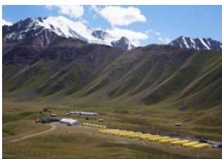
Bishkek 📍 ✈️ 600km - ⌚ 40m Och 📍 🚗 290km - ⌚ 8h Achik-Tash Base Camp (3600 m) 📍