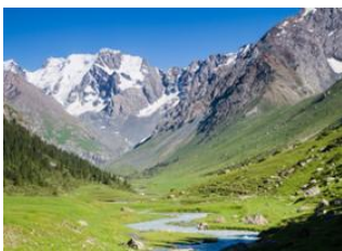
Telety Valley 📍 17km - ⌚ 6h Karakol valley 📍