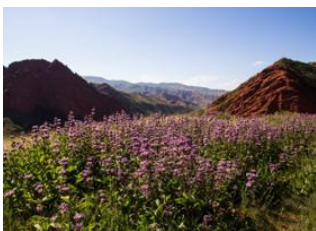
Jety-Öghüz 📍 16km - ⌚ 5h Telety Valley 📍