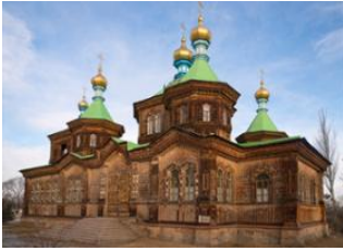
Altyn-Archan 📍 18km - ⌚ 5h Karakol 📍