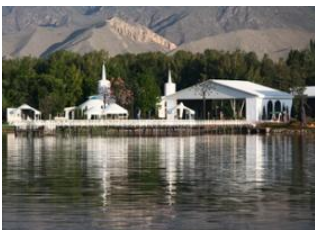
Karakol 📍 🚗 130km - ⌚ 2h 50m Grigorievka 📍 🚗 34km - ⌚ 25m Cholpon ata 📍