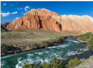
Lac de Son kul 📍 🚗 140km - ⌚ 4h Kyzyl-Oi 📍