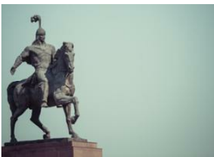
Kyzyl-Oi 📍 🚗 240km - ⌚ 4h 10m Bishkek 📍