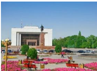
Aéroport de Manas 📍 🚗 30km - ⌚ 40m Bishkek 📍