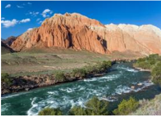
Lac de Son kul 📍 🚗 140km - ⌚ 4h Kyzyl-Oi 📍