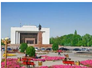
Aéroport de Manas 📍 🚗 30km - ⌚ 40m Bishkek 📍