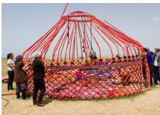
Barskoön ♡ 🚗 87km - ⌚ 1h 15m Kyzyl-Tuu ♡