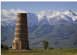
Bishkek 📍 🚗 90km - ⌚ 1h 40m Minaret de Burana 📍 🚗 300km - ⌚ 4h Kyzyl-Suu 📍