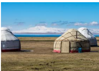
Kyzyl-Tuu ♡ 🚗 130km - ⌚ 2h 30m Kyzart ♡ 18km - ⌚ 5h Lac de Son kul ♡