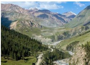
Lac Ashil ♡ 28km - ⌚ 6h Barskoön ♡