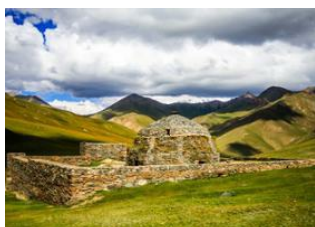
Lac de Son kul 📍 🚗 190km - ⌚ 5h Tach Rabat 📍