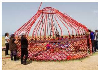
Tach Rabat 📍 🚗 240km - ⌚ 4h 30m Kochkor 📍 🚗 90km - ⌚ 1h 15m Kyzyl-Tuu 📍