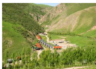
Aéroport de Manas 📍 🚗 60km - ⌚ 1h 30m Karabulak 📍