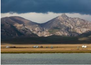
Kyzyl-Oi 📍 🚗 140km - ⌚ 4h Lac de Son kul 📍