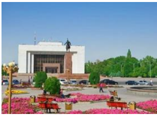
Bokonbayevo 📍 🚗 280km - ⌚ 5h Bishkek 📍