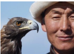
Lac de Son kul 📍 🚗 120km - ⌚ 2h 40m Kochkor 📍 🚗 120km - ⌚ 1h 40m Bokonbayevo 📍