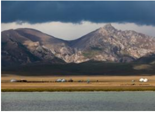
Kyzyl-Oi 📍 🚗 140km - ⌚ 4h Lac de Son kul 📍