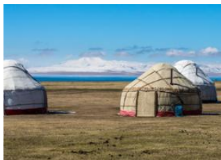
Kyzyl-Oi 📍 🚗 180km - ⌚ 4h Lac de Son kul 📍