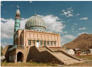
Kel-Suu 📍 🚗 200km - ⌚ 5h Naryn 📍