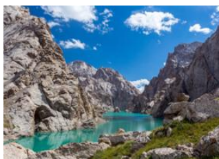
Tach Rabat 📍 🚗 230km - ⌚ 6h Kel-Suu 📍