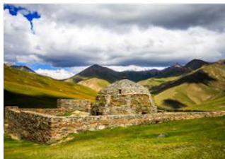
Lac de Son kul 📍 🚗 260km - ⌚ 5h Tach Rabat 📍