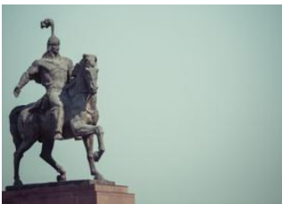
Naryn 📍 🚗 120km - ⌚ 1h 40m Kochkor 📍 🚗 200km - ⌚ 3h 30m Bishkek 📍