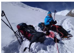
Camp N°2 Lenine