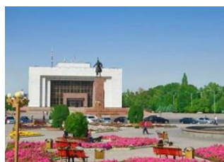
Aéroport de Manas 📍 🚗 30km - 🕒 40m Bishkek 📍