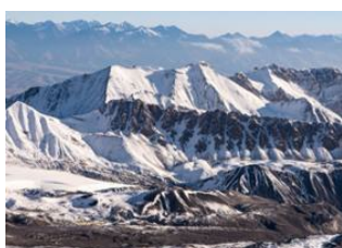
Achik-Tash Base Camp (3600