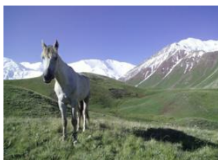
Camp N°1 Lenine 📍 12km - ⌚ 4h Achik-Tash Base Camp (3600 m) 📍