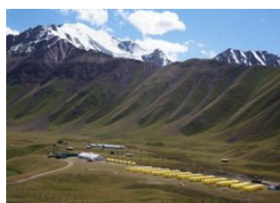
Bishkek 📍 ✈️ 600km - 🕒 40m Och 📍 🚗 290km - 🕒 8h Achik-Tash Base Camp (3600 m) 📍