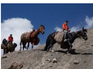
Achik-Tash Base Camp (3600 m) 📍 12km - ⌚ 6h Camp N°1 Lenine 📍