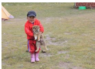
Camp N°3 Lenine (6100m)