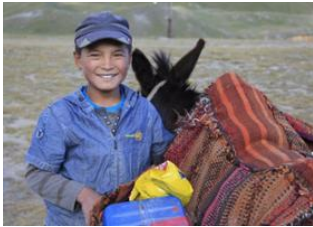
Achik-Tash Base Camp (3600 m) 📍