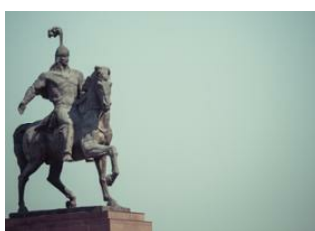
Och 📍 ✈ 600km - ⌚ 40m Bishkek 📍